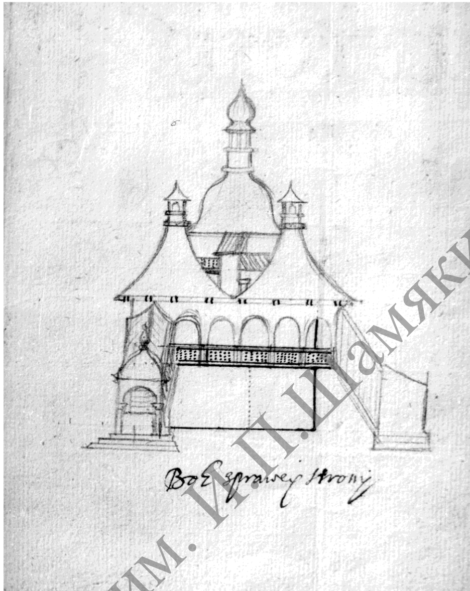
Малюнок 2 – Брама ў Дурэнічах. Бакавы фасад. Эскіз Багуслава Радзівіла XVII ст.