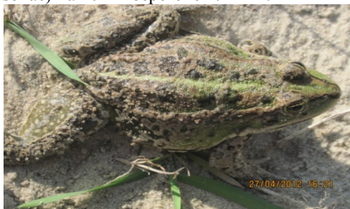
Рисунок 5 – Внешний вид прудовой лягушки ( Rana lessonae )

Следующим представителем зеленых лягушек является прудовая лягушка ( Rana lessonae ). В 2012 г. в Гомельской области, на окраине Мозыря, в стороне Пхов, справа от реки Припять, а слева от проезжей части был замечен небольшой водоем, который со всех сторон хорошо прогревается солнцем. За весь период исследований в данном водоеме было насчитано 70 особей прудовой лягушки ( Rana lessonae ) на 40 м 2 береговой линии.