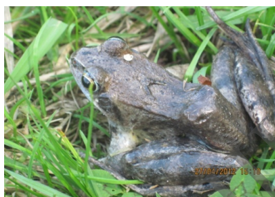
Рисунок 1 – Внешний вид травяной лягушки ( Rana temporaria )

В 2011 году, начиная с 16 апреля и по 22 сентября, Бобровское озеро № 1 и Бобровское озеро № 2 были заселены особями травяной лягушки ( Rana temporaria ). В 2012 году на Бобровском озере № 1 не было обнаружено ни одной особи данного вида. Это связано с интенсивным загрязнением озера промышленными отходами. В то время как на Бобровском озере № 2 эти особи заняли почти все территорию.