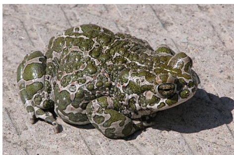
Рисунок 3 – Внешний вид зеленой жабы ( Bufo viridis )

В 2013 г. особей остромордой лягушки ( Rana arvalis ) не было отмечено, так как особи травяной лягушки ( Rana temporaria ) заселили все озера и тем самым вытеснили данный вид. Но в этом году симпатрично с особями травяной лягушки ( Rana temporaria ) существовали особи зеленой жабы ( Bufo viridis ).