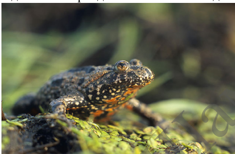
Рисунок 4 – Внешний вид краснобрюхой жерлянки ( Bombina bombina )

Очень необычайно привлекательным видом краснобрюхая жерлянка ( Bombina bombina ). На Полесье она ( Bombina bombina ) очень хорошо приживается в местах, используемых для хозяйственной деятельности человека. В городе Мозыре краснобрюхая жерлянка ( Bombina bombina ) заселила густонаселенный район на Бобровском озере № 2. 16 апреля 2011 года было отмечено 50 ос/га. Температура воды в этот период колебалась от + 14 до + 16° С.