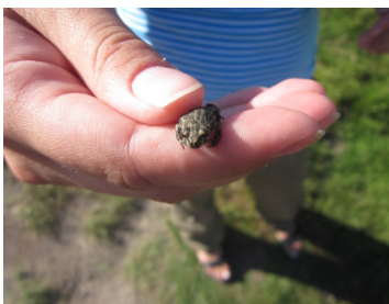
Рисунок 7 – Сеголеток чесночницы обыкновенной

В городе Мозыре первые кладки отмечены 16.04 на Бобровском озере № 2 в 2011 году. В последующие годы данный вид здесь не был описан. Выход сеголеток в конце июня – начале июля. Их размеры около 2,5 см.