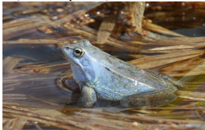
Рисунок 2 – Внешний вид остромордой лягушки ( Rana arvalis )

Интересной особенностью является симпатрия этих видов. Там, где живут остромордые лягушки ( Rana arvalis ), травяных ( Rana temporaria ) не бывает и наоборот.